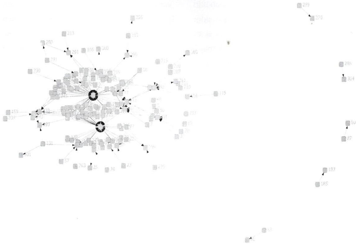
Gambar 3. Jaringan komunikasi tentang kapan waktu mengungsi

dan terlihat tanda-tanda erupsi aktor-aktor berusaha memperoleh informasi mengenai dimana saja lokasi yang disediakan sebagai tempat pengungsian. Terdapat beberapa lokasi yang disediakan pemerintah lokal untuk menampung warga yang mengungsi bersama warga dari dusun-dusun lainnya. Lokasi yang disiapkan untuk menampung pengungsi antara 10 hingga 20 kilometer dari lokasi dusun tempat tinggal warga. Terdapat enam aktor yang tidak berelasi atau terpisah dengan jaringan yang dekat dengan aktor sentral, namun masing-masing aktor terikat dalam komponen dengan satu aktor lainnya. Informasi mengenai lokasi pengungsian amat penting bagi hampir seluruh aktor sehingga banyak aktor berupaya menghubungi aktor-aktor di posisi sentral. Ketergantungan hampir