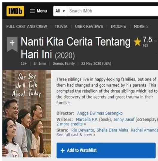
Gambar 4. Film NKCTHI

Melalui film akan disampaikan pesan tertentu ( message ) melalui gambar, dialog, setting gambar, penokohan, plot alur cerita, simbol-simbol, musik dan apa yang disajikan di layar lebar. Film mampu secara efektif digunakan sebagai media untuk menyebarkan misi, gagasan, dan kampanye apapun pesan yang akan disebar atau disampaikan seseorang, lembaga atau pemerintah.