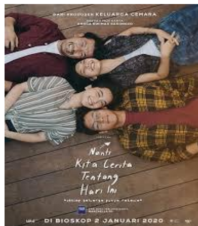
Gambar 2. Poster Film NKCTHI