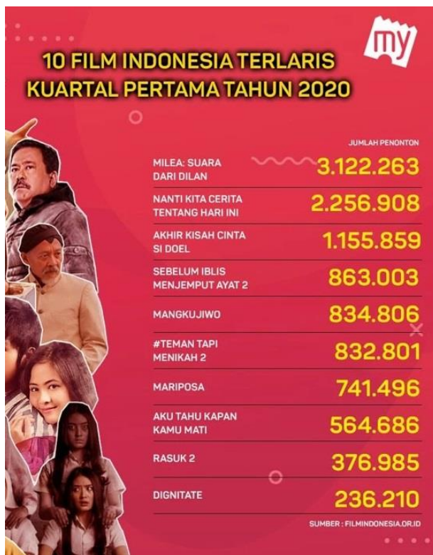
Gambar 3. Data Film Indonesia Terlaris (kuartal pertama, Tahun 2020)

NKCTHI menjadi film ke-13 yang diproduksi Visinema Pictures dan tayang serentak di bioskop Indonesia pada 2 Januari 2020, sekaligus menandai 15 tahun kiprah Sutradara Angga Dwimas Sasongko di dunia penyutradaraan, dan satu dekade Rio Dewanto -pemeran Angkasa-- berkarya sebagai aktor. "Terima kasih penonton Indonesia, yang pasti saya sangat bahagia karena pesan dalam film ini bisa sampai ke sejuta hati," kata sutradara Angga Dwimas Sasongko, seperti dikutip dari rilis yang diterima Suara Pembaruan, edisi Jumat 10 Januari 2020. [11]