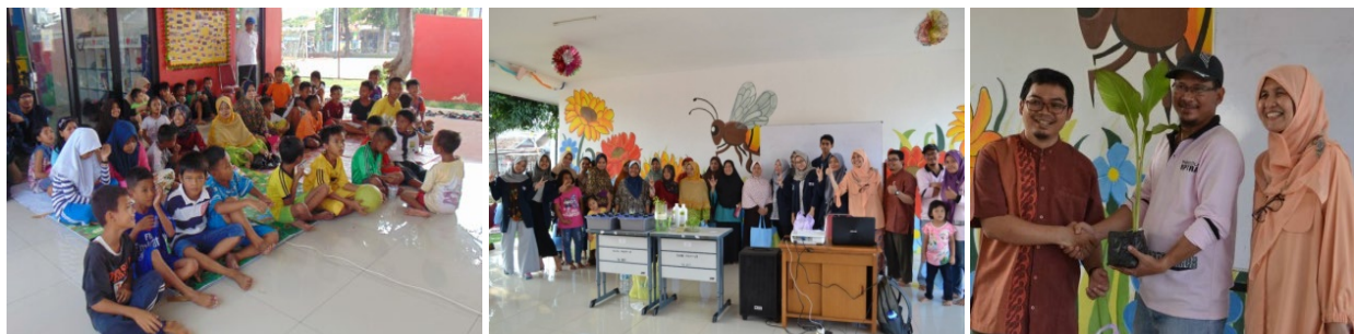
Gambar 2. Beberapa dokumentasi saat sosialisasi hidroponik kepada masyarakat